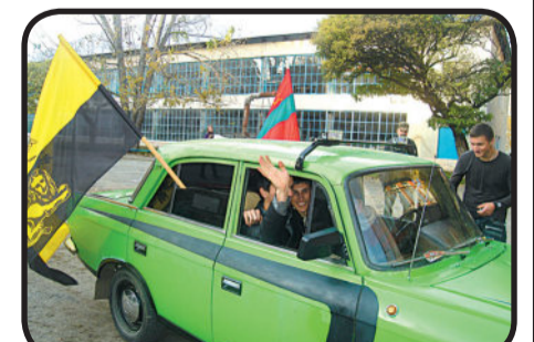
Автошоу Стр. 3