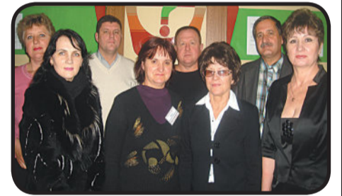
Главные компетенции - профессиональные Стр. 3