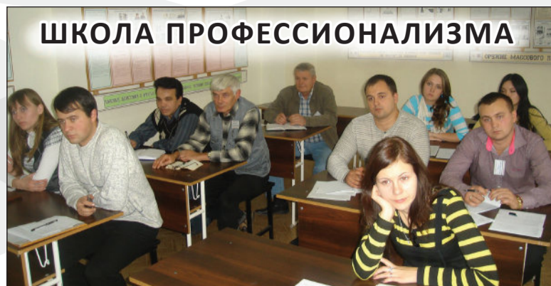
Школа начинающего педагога (ШНП) предполагает непрерывное совершенствование уровня педагогического мастерства начинающего преподавателя, его эрудиции и компетенции.

Профессионализм приходит к педагогу с опытом. Практика же показывает, что начинающие учителя подготовлены к профессии более теоретически, нежели практически. При этом с первого же дня работы начинающие педагоги имеют те же обязанности и несут ту же ответственность, что и учителя с многолетним стажем.