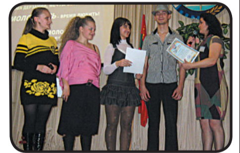
Декада молодежи зажигает... звезды! Стр. 2