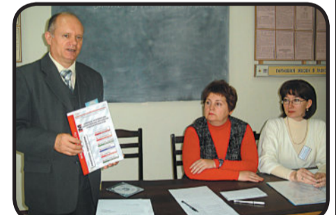
Школа профессионализма Стр. 3