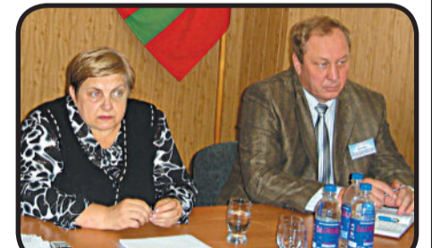
Новыми образовательными стандартами управляют.. Стр. 3